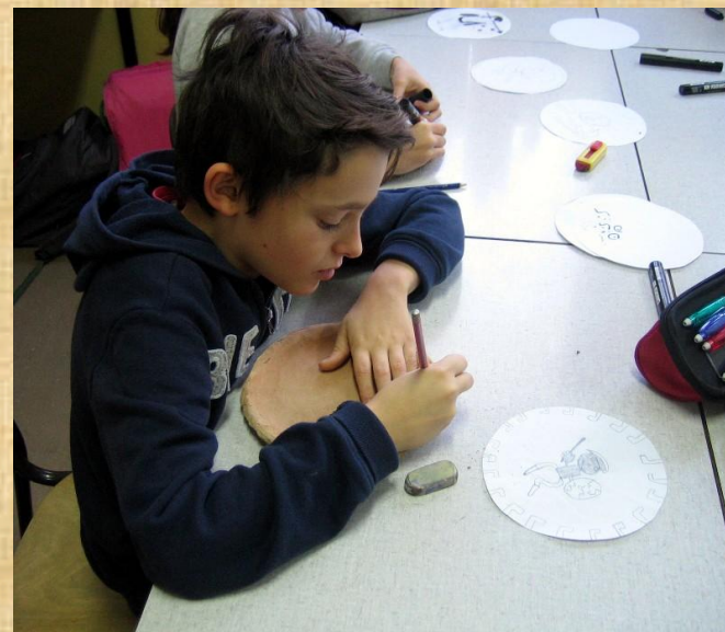
... insieme all'esperta Melania