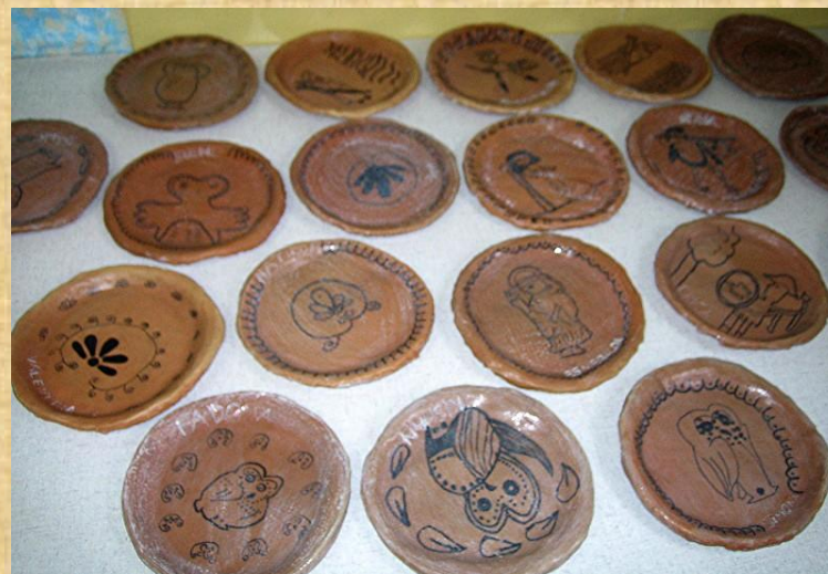
Infine, li abbiamo cosparsi con una miscela di colla vinilica, per renderli lucidi ...